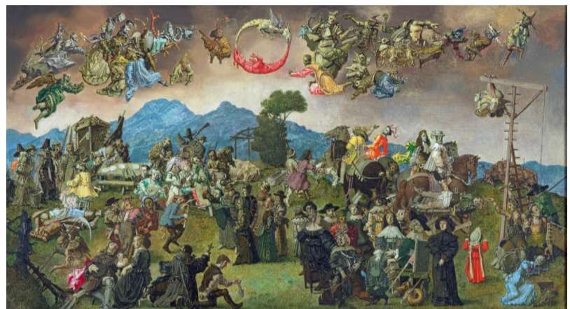
Im Jahr 1991 schuf Werner Tübke die Ausstattung für eine eindrucksvolle «Freischütz»-Inszenierung. Im Theatermuseum von Meiningen ist derzeit der faszinierende Bühnenvorhang zu sehen