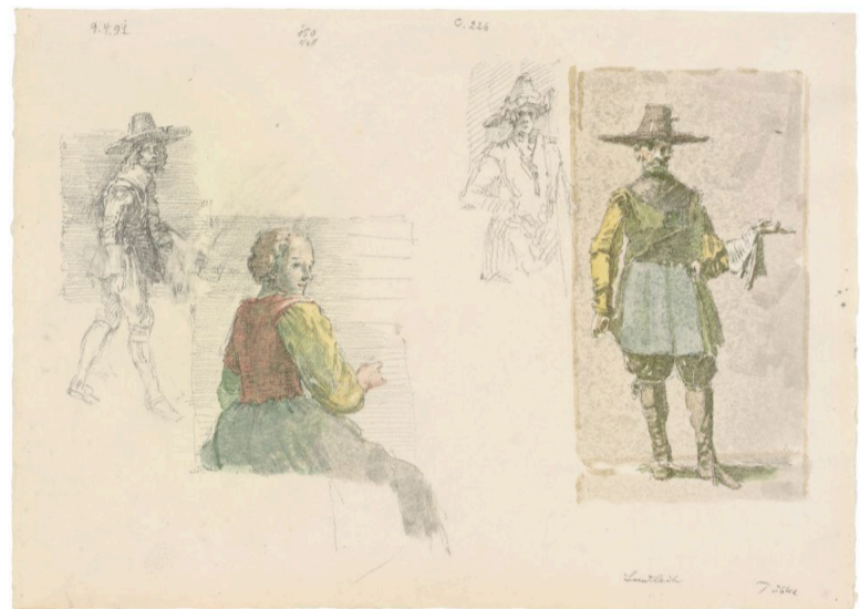
Werner Tübke: Figurinen zu «Der Freischütz» (1991), Aquarell auf Büttchen